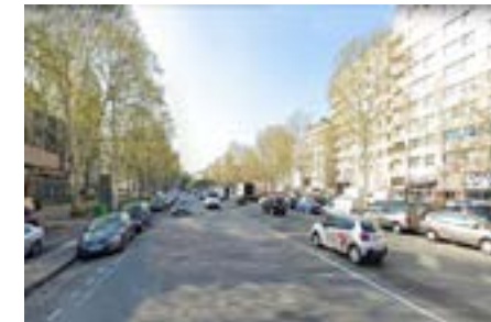
La rue de la Chapelle avant

" Faire de ce lieu de passage un véritable lieu de vie apaisé, végétalisé et attractif."