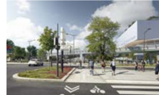
Devant la future Aréna 2