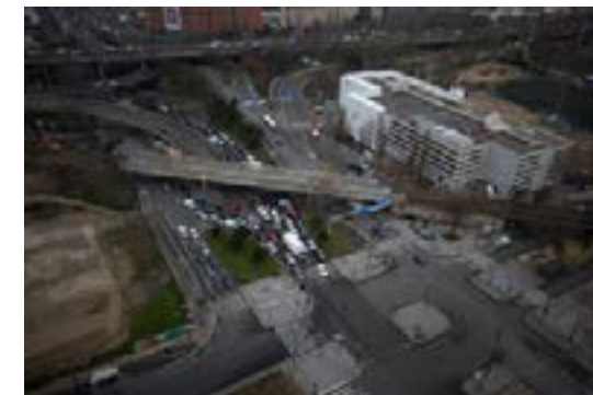
État existant de la porte de la Chapelle

Anne Hidalgo est allée chaque semaine dans le quartier de la Chapelle depuis mars 2019 au contact de ses habitants, de ses commerçants et de ses associations afin de les écouter, de dialoguer avec eux et de répondre à leurs attentes. La porte de la Chapelle est un exemple de tous les problèmes et difficultés que la construction du périphérique et la création d'un échangeur autoroutier en plein cœur de la ville peuvent engendrer.