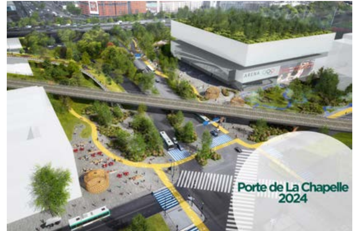
La Porte de La Chapelle en 2024 crédit: Luxigon