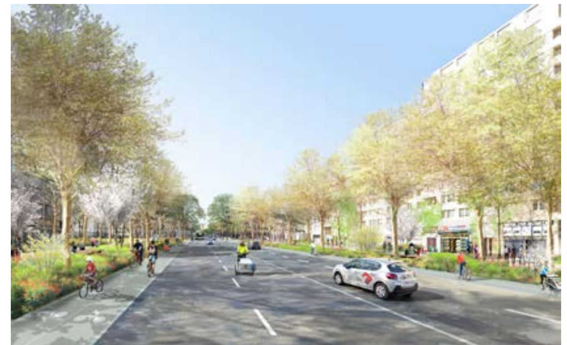
Nouvelle rue de La Chapelle

" Faire de ce lieu de passage un véritable lieu de vie apaisé, végétalisé et attractif."