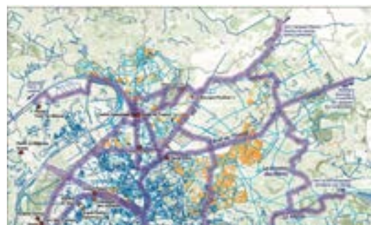
Projet de la boucle olympique