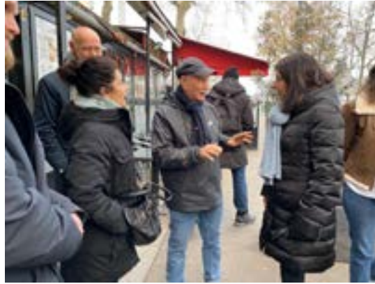
Anne Hidalgo en visite hebdomadaire à la rencontre des habitants, commerçants et associations du quartier de la Chapelle